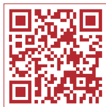
深圳市银行业协会 官网二维码