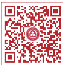
深圳市银行业协会 微信公众号二维码